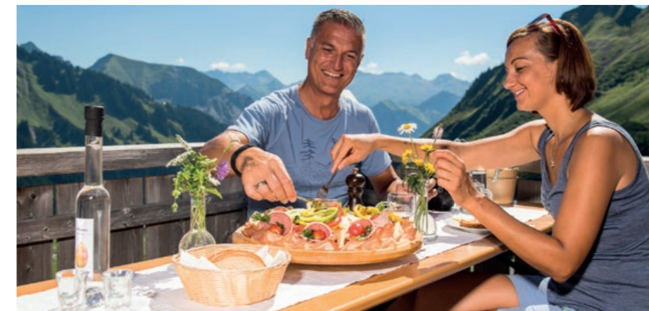
LINKS Speck und Bergkäse gehören zu jeder traditionellen Hüttenjause.

Die herzliche Gastfreundschaft der Walser ist überall spürbar, in der kleinen Pension genauso wie im Viersternebetrieb. Und wo wir gerade bei den kleinen und grossen Urlaubsfreuden sind: Ab der dritten Übernachtung erhalten alle Gäste die «Sommer Inklusiv Card Bregenzerwald»: Unbegrenzt Bergbahn fahren, geführte Wanderungen, Eintritte in die Schwimmbäder der Region und die öffentlichen Verkehrsmittel sind frei. Da freut sich das Urlaubsbudget.